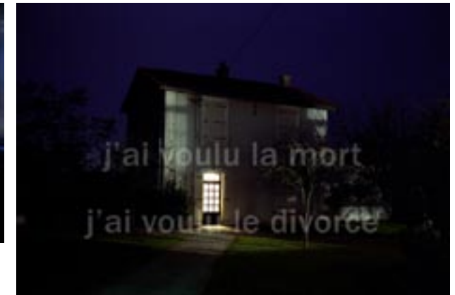
« Paysages familiers », Lionel Pralus