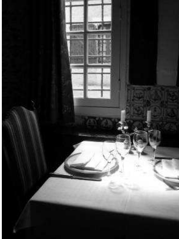
Restaurant Guillaume Le Conquérant, Dives-Sur-Mer

L'ambiance confinée que ceci procure me semble être juste pour la scène qui s'y déroule ; il faudra néanmoins arranger la disposition des tables pour rendre possible le déplacement de Saint-Loup. L'ambiance lumineuse est très proche de ce qui est décrit dans le scénario. Pinter évoque la ressemblance à l'aquarium.