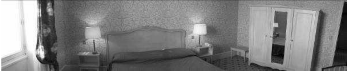
Grand-hôtel de Cabourg, chambre 415

La chambre d'Albertine doit être plus petite. Une chambre comme la 415 convient :