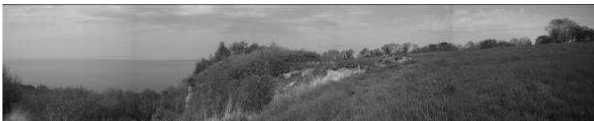
La grande falaise

Je propose deux lieux pour ces séquences : un grande et une petite prairie au bord d'une falaise. Il s'agit de la portion de côte appelée « la falaise des vaches noires », près de Villiers sur Mer.