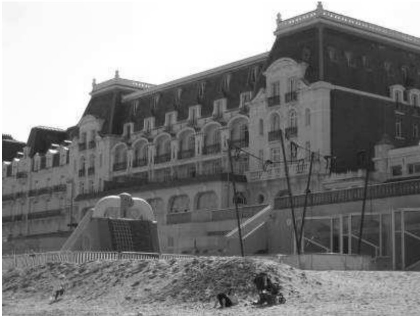
Plage de Cabourg

La plage pose quelques problèmes : une piscine a été construite au niveau de la mer avec des fenêtres avancées vers la plage.