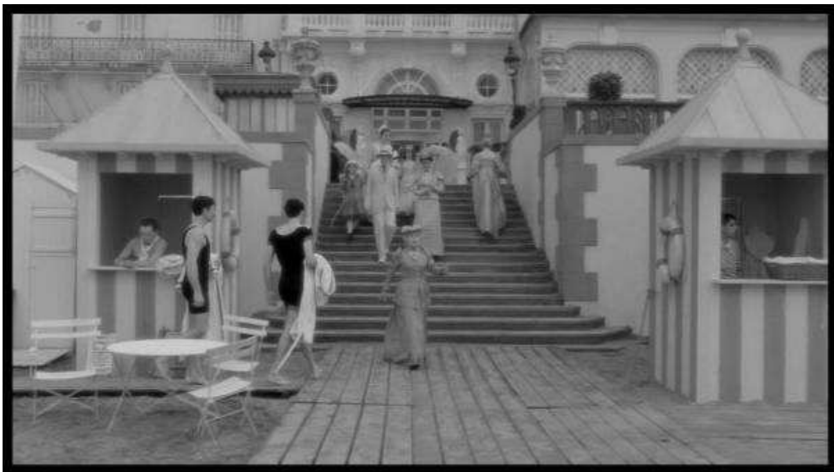
©Le Temps Retrouvé, Raoul Ruiz

Mise à part la façade côté ville, l'extérieur de l'hôtel de Cabourg semble adapté au tournage du Scénario Proust . Les aménagements des décors pour recréer l'ambiance du début du 20 ème siècle sont minimes, il s'agit surtout d'accessoirisation des lieux.