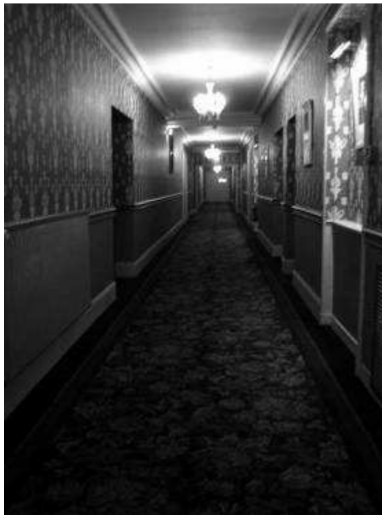
Grand-hôtel de Cabourg Couloir

Le couloir fait bien illusion, il n'y a pas de grandes modifications nécessaires.