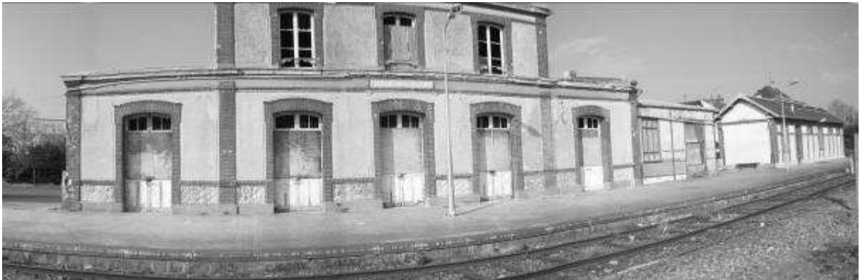
Gare de Houlgate

On pourrait donc tourner dans les deux gares. Celle de Cabourg offre l'avantage d'être restaurée, elle demanderait donc moins de travaux d'aménagements de la part de l'équipe de décoration. La gare de Houlgate serait cependant beaucoup moins chère à la location puisque le tournage ne générerait pas l'activité de la SNCF.