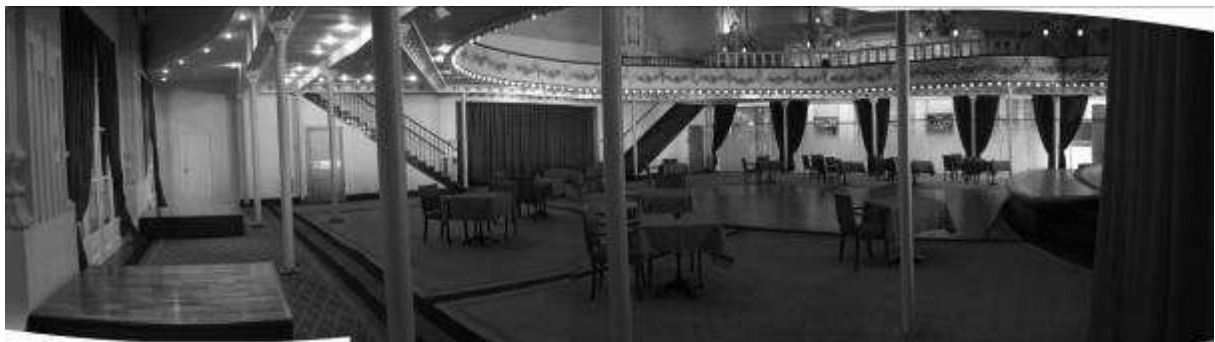
Théâtre à l'italienne, Casino de Cabourg