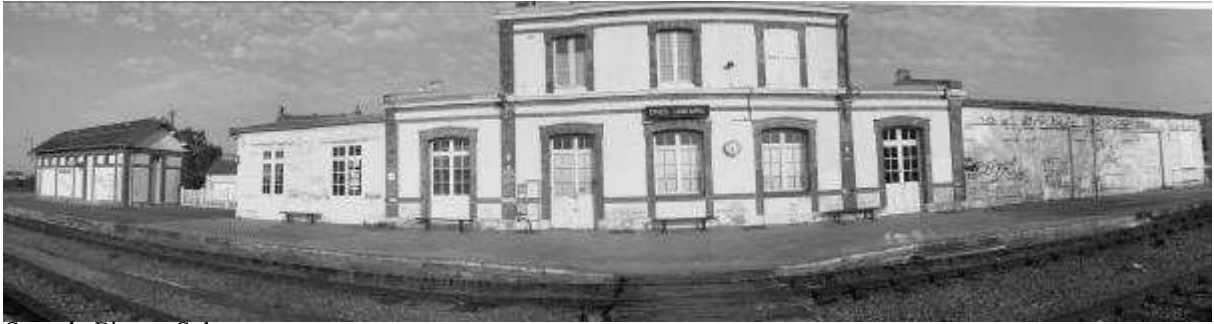
Gare de Dives - Cabourg