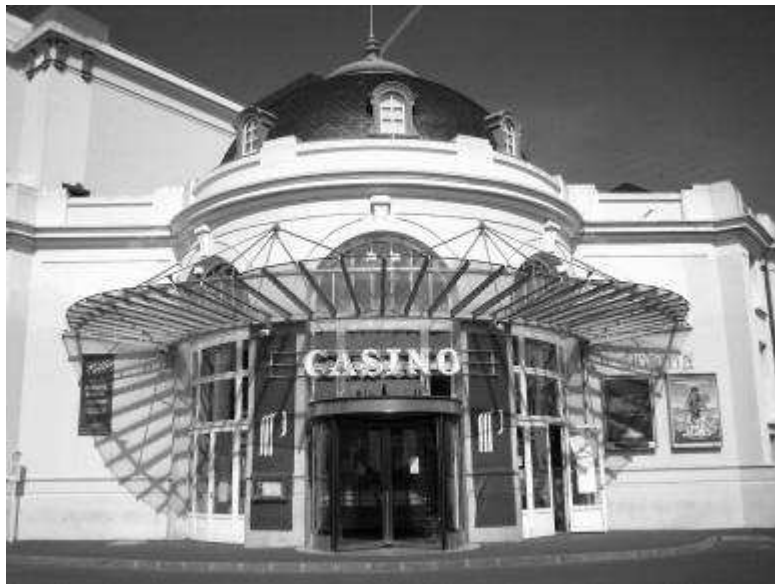
Façade du Casino de Cabourg

Il est primordial pour la mise en scène que le Grand-hôtel et le Casino se trouvent côte à côte puisque les personnages se rendent de l'un à l'autre à pied. Le casino de Cabourg est voisin du Grand hôtel. Son apparence extérieure convient au scénario de Pinter. Seuls quelques aménagements seront à faire, tel enlever les enseignes.