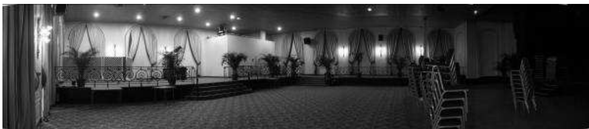
Salle de réception du Casino de Trouville

La salle de réception du Casino de Trouville pourrait convenir.