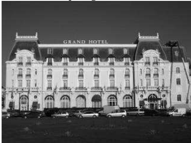
Façade du Grand Hôtel de Cabourg

La façade côté ville est difficilement utilisable. Il y a très peu de recul et de nombreux éléments anachroniques gênants.