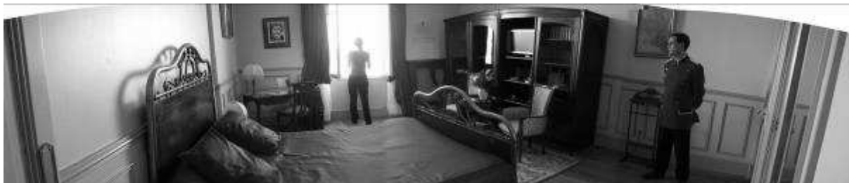
La Chambre 414 du Grand-hôtel de Cabourg

Les chambres ont bien sur été modernisées, mais une reconstitution de la chambre de Marcel Proust a été réalisée, la chambre 414. Elle donne sur la mer, et contient presque tout le mobilier décrit dans le scénario (bibliothèque vitrée, bureau).