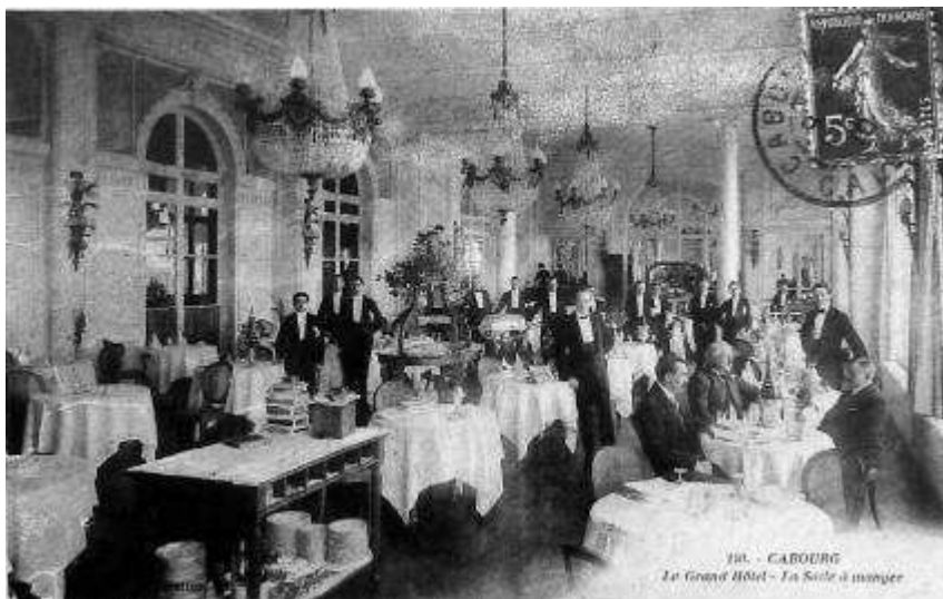
La Salle à Manger du Grand-hôtel de Cabourg, 1907

A l'époque où Marcel Proust fréquentait l'hôtel, voici à quoi ressemblait cette salle :