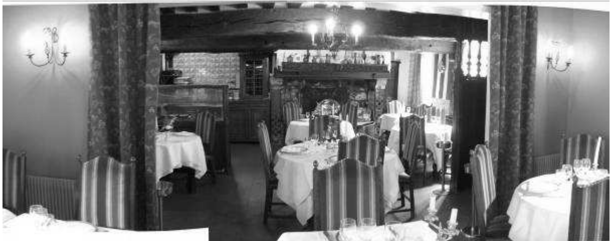
Restaurant Guillaume Le Conquérant, Dives-Sur-Mer

La salle n'est pas très grande et est très basse de plafond.