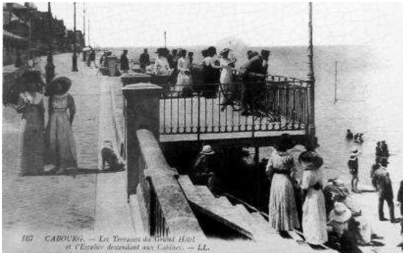
Carte Postale Ancienne, La digue de Cabourg

Contrairement à des villes avoisinantes, le bord de mer est entièrement piéton. La promenade s'appelle d'ailleurs « Promenade Marcel Proust ».