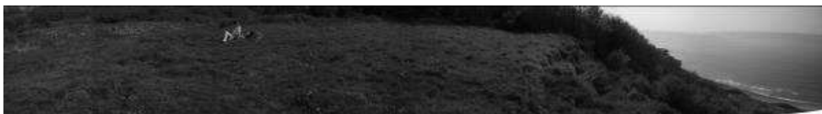
La petite Falaise

Ce sera un choix du réalisateur de préférer un espace grand ou plus restreint. La grande prairie offre plus de perspectives visuelles et permet de voir arriver Andrée de très loin. Elle évoque plus l'isolement de Marcel avec la bande de jeunes filles. Ils seraient allés loin pour être tranquilles. D'un autre côté, la petite prairie fait d'avantage penser à une air de pique-nique aux abords de la ville. Le sentiment dégagé par ce lieu n'est pas le même ; il y a plus de risque que les jeunes gens soient vus. Ils sont moins isolés, on ressent moins leur envie d'être seul. Toute fois, le risque d'être surpris par d'autres promeneurs peur ajouter une valeur à la scène. Le choix sera donc esthétique d'une part, et sémiologique d'autre part.