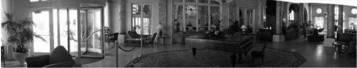
Le hall du grand-hôtel de Cabourg

La porte à battants circulaires est récente, mais elle peut passer pour une porte de l'époque.