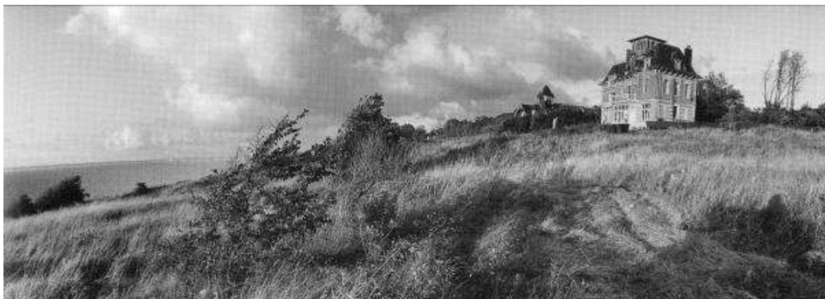
Villa de Hennequeville, François-Xavier Bouchart

Je suis partie avec cette photographie en tête :