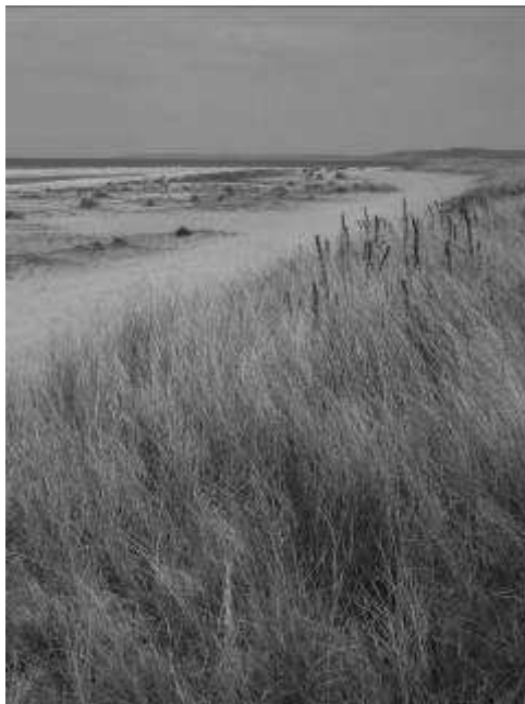
Plage de Merville-Franceville

La côte a été beaucoup construite mais la plage de Merville-Franceville-Plage et son camp naturiste restent assez sauvages.