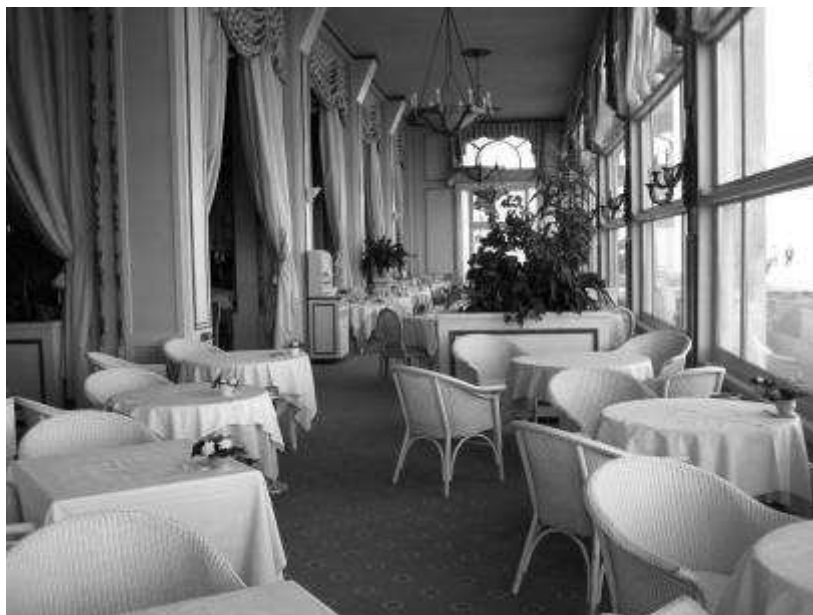
La salle à manger du Grand-hôtel de Cabourg

Elle a été rénové fidèlement, certains lustres sont même d'époque :