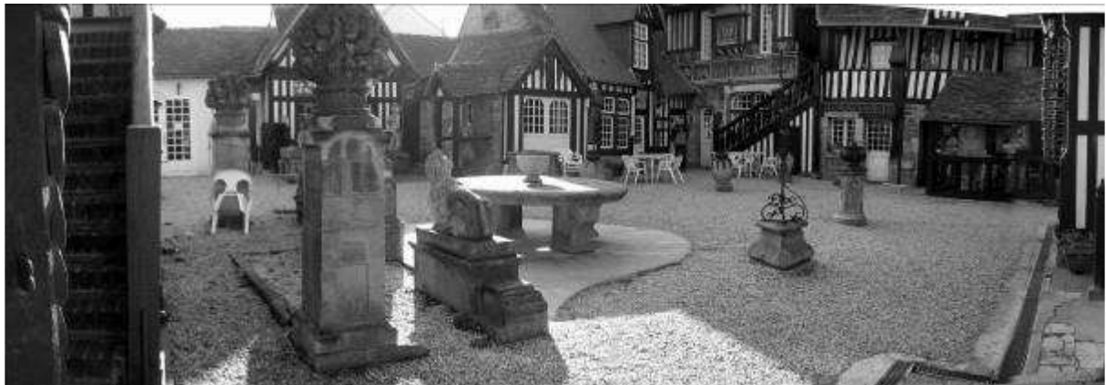
Village d'Art, Dives-Sur-Mer

Marcel Proust était un habitué du restaurant Guillaume le Conquérant à Dives sur mer. Ce restaurant fait maintenant partie d'un ensemble appelé « village d'art ». Les bâtiments à colombage ont été restaurés à l'identique et on peut croire que c'est ce même décor qu'avait connu Proust.