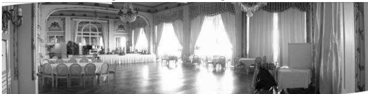
La salle à manger du Grand-hôtel de Cabourg